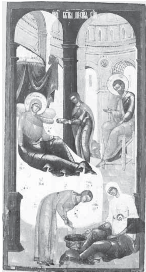
21 сентября, вторник Рождество Пресвятой Богородицы

Газета подготовлена силами прихода Святых мучеников, бессребреников и чудотворцев Космы и Дамиана (г. Жуковский) | 484-89-71 | Выпускается раз в месяц | pokrov.listok@ya.ru