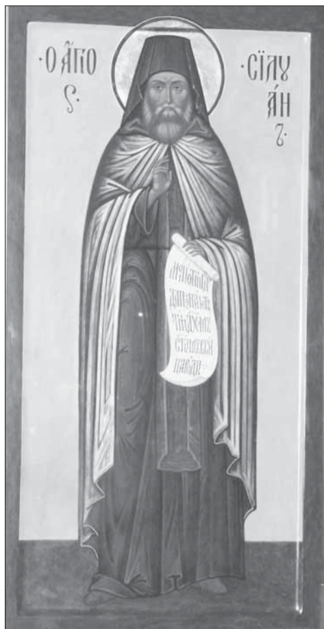
Икона св. Силуана, находящаяся в нашем Покровском храме

В эти бедственные дни святой Захария исполнял свою чреду служения в Иерусалимском храме. Воины, посланные Иродом, тщетно пытались узнать у него, где находится его сын. Тогда, по повелению Ирода, они убили святого пророка, заколов его между жертвенником и алтарем. Праведная Елисавета скончалась через 40 дней после своего супруга, а святой Иоанн, хранимый Господом, пребывал в пустыне до дня своего явления израильскому народу.