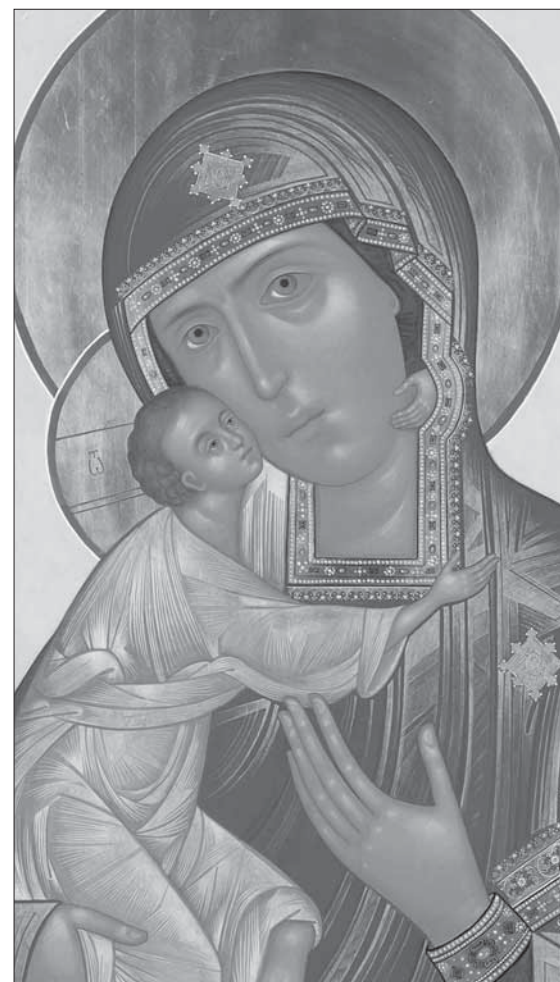
БОЛЬНИЧНАЯ ЦЕРКОВЬ КОСМЫ И ДАМИАНА в гор. Жуковский