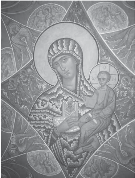
Фрагменты храмовой росписи. Божия Матерь «Неопалимая Купина»