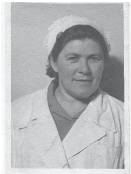
1956 год. Зугдиди, Грузия