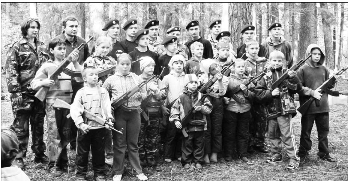
Участники военно-спортивной игры: Центр вневоинсковой подготовки «Каскад» и детская воскресная школа «Звонница» Космо-Дамианского (Покровского) храма.

Ты Сам сказал: стучите — отворят; Исправь меня! - я в Небеса взываю. Ты - мой Господь, и в каждом слове свят, Прости меня, отверзи двери Рая.