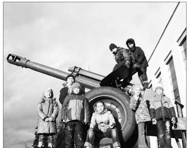
На территории Музея Вооруженных сил.