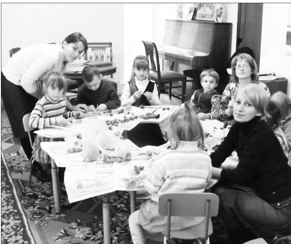
«Добрые ручки». На занятии кружка (рисование, лепка, конструирование, аппликация).