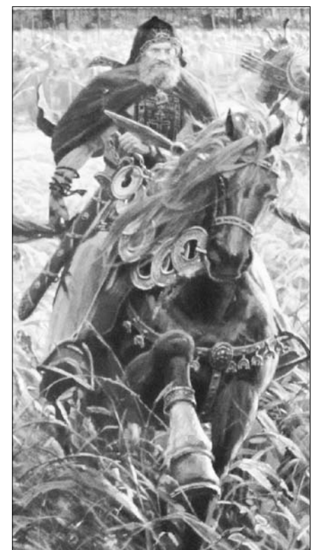
П. Рыженко «Пересвет». Фрагмент картины.