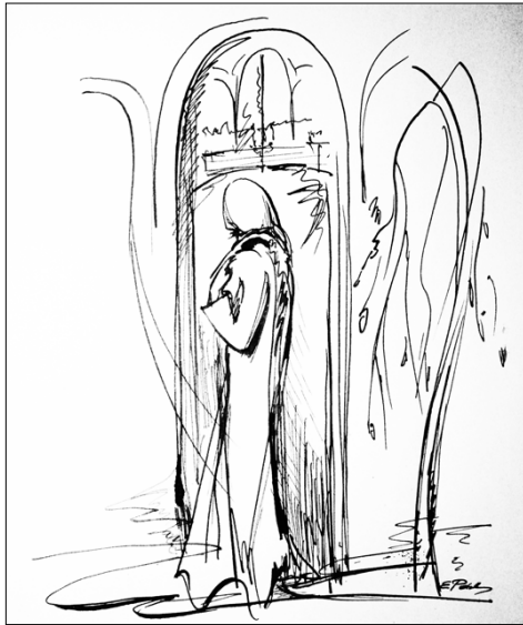
Графика Елены Романовой