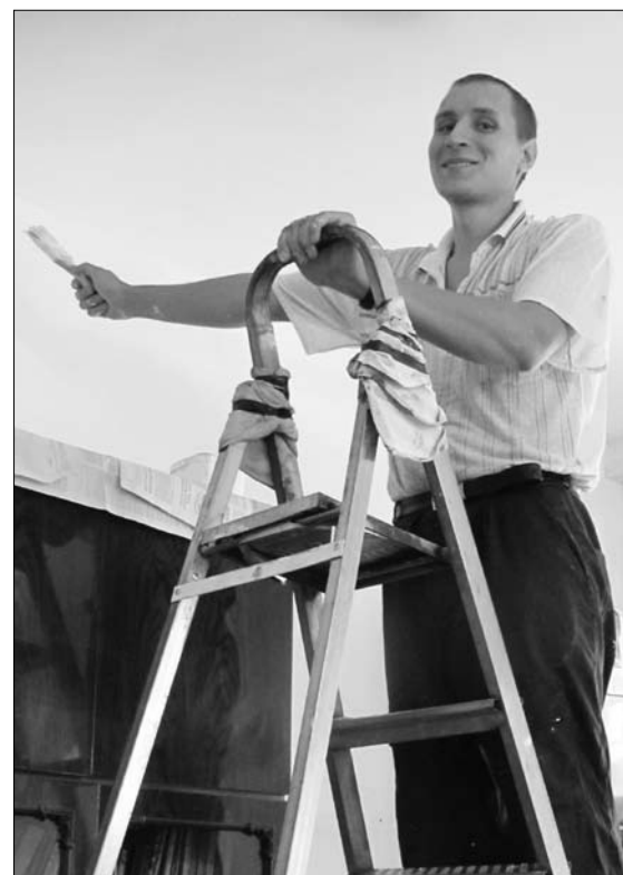
Ремонт в воскресной школе.