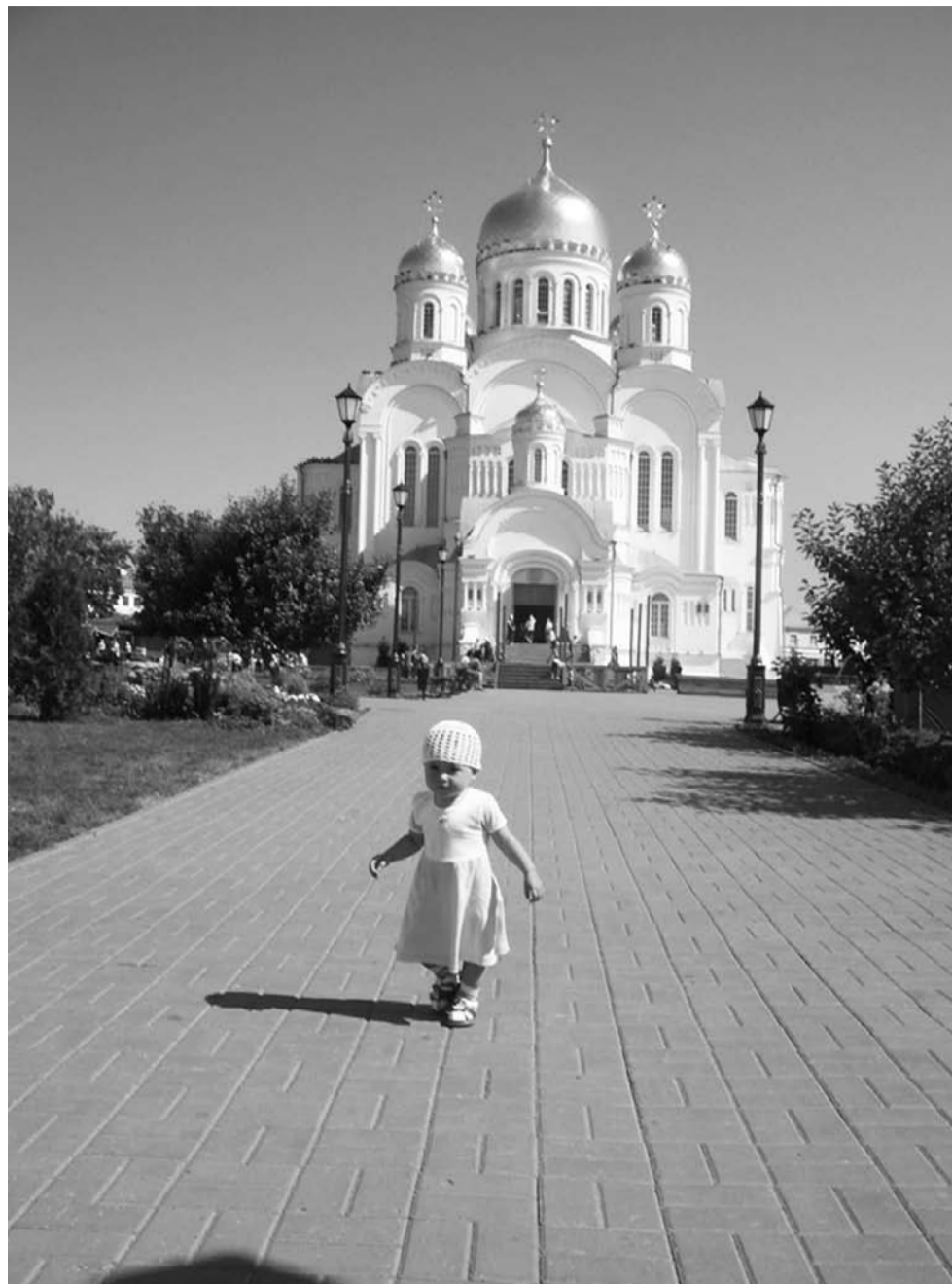
В Серафимо-Дивеевском монастыре

В 1903 году, через 70 лет после кончины, состоялось прославление преподобного Серафима Саровского — он