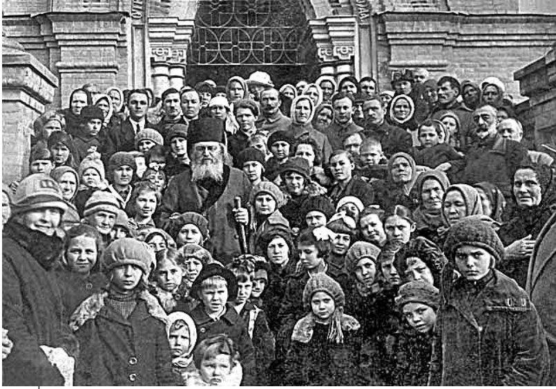
Архиепископ Лука в окружении паствы.

В феврале 1940 года Войно-Ясенецкому назначили 5 лет ссылки в Красноярский край. Это был его третий ссылка по обвинению «в создании контрреволюционной церковно-монашеской организации» и даже в убийствах пациентов на операционном столе, что особенно оскорбляло человека всю свою жизнь посвятившего излечению людей. С марта 1940 года епископ работает хирургом в ссылке в районной больнице. С началом войны 1941 года он отправляет телеграмму М. Калинин с просьбой направить его на фронт. С октября 1941 года он стал консультантом всех госпиталей Красноярского края и главным хирургом эвакогоспиталя. Он работал по 8–9 часов в день, что в его возрасте (64 года) было тяжело. В начале марта 1943 года святитель добился открытия маленькой кладбищенской церкви в слободе Николаевка, предместье Красноярска.